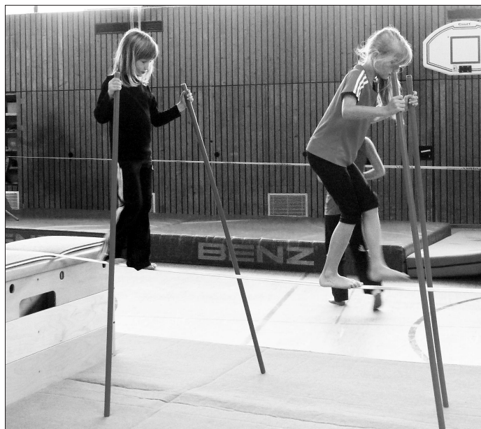
Damit die Kinder ein Gefühl für die Slackline bekommen, durften sie es erst mit »Stöcken« probieren.

Als die kleinen Teilnehmer am Ende der Stunden fragten: »Wann sehen wir uns das nächste Mal, wann kann ich wieder mitmachen?«, war sonnenklar – der Kurs war ein riesiger Erfolg. So konnten zwei Fliegen mit einer Klappe geschlagen werden: Die Kinder wurden an die neue Trendsportart herangeführt und auch für kurze Zeit vom verregneten Ferienwetter abgelenkt.